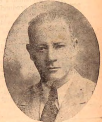
A los 50 años