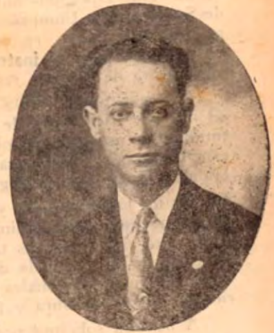
A los 25 años