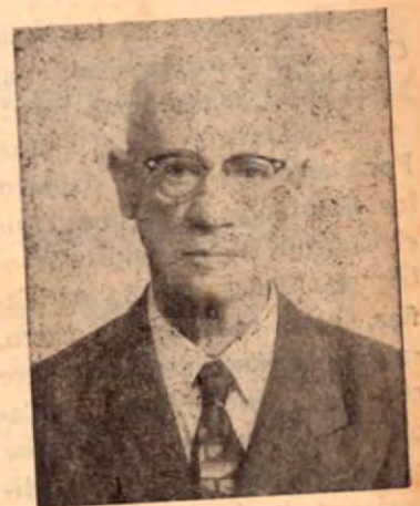
A los 65 años