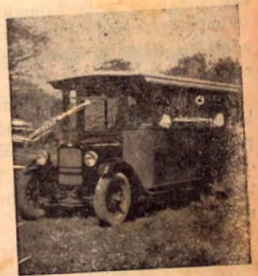
L a Papaya en 1927, tal y como la llamaba le público.